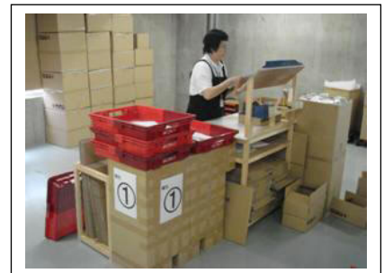
帳票類が混入しない作業台

また多種の使いやすく工夫された器具類はデータベース化されており、横展開できるようになっています。