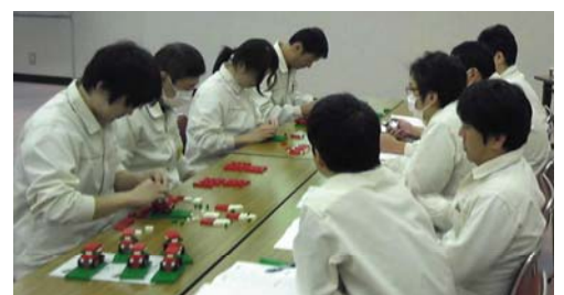
ラインバランスを体験する「模擬生産演習」