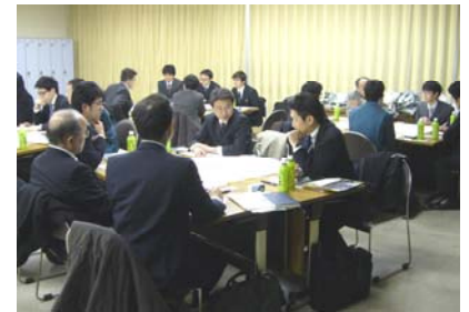
【意見交換会の様子】

当協会が提供する講座、イベントなどへ、貴社のどなたでも会員価格にて参加できます。一般価格より平均20%ほど割安となります。 定員を超えた場合には、会員の方々は「優先して」参加いただけます。 また、複数枚をひとまとめにした共通チケットを準備しておりますので、ご活用ください（約20%引き）。