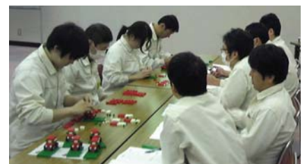
ラインバランスを体験する「模擬生産演習」