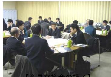
【意見交換会の様子】

当協会が提供する講座、イベントなどへ、会員価格にて参加できます。 一般価格より平均20%ほど割安となります。 定員を超えた場合には、会員の方々は「優先して」参加いただけます。 また、複数枚をひとまとめにした共通チケットを準備しておりますので、 ご活用ください（約20%引き）。