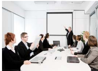
【プレゼンテーション・イメージ】