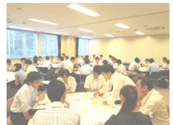
【意見交換会・イメージ】