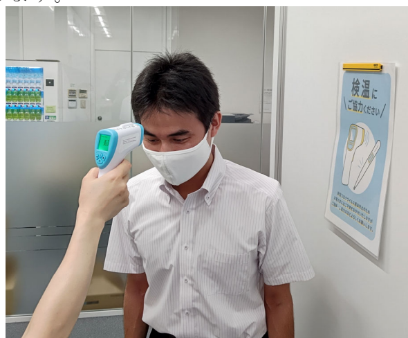
会場入口での受付時に、非接触型体温計にて体温測定をさせていただきます。