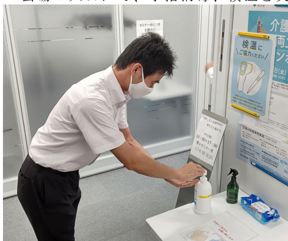
出入口に消毒液を準備していますので、入室の際は手指の消毒をお願いします。