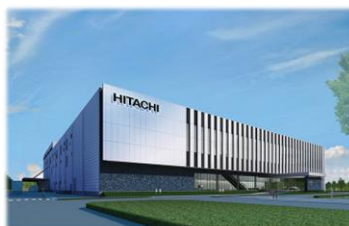
笠戸地区に半導体製造装置の新製造棟を建設： 日立ハイテク (hitachi-hightech.com)