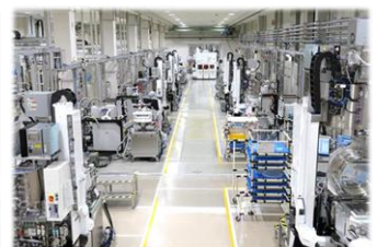
日立のLumadaソリューションを通して、日立ハイテク の半導体製造装置における生産計画の自動立案を実現。 日立ハイテク (hitachi-hightech.com)